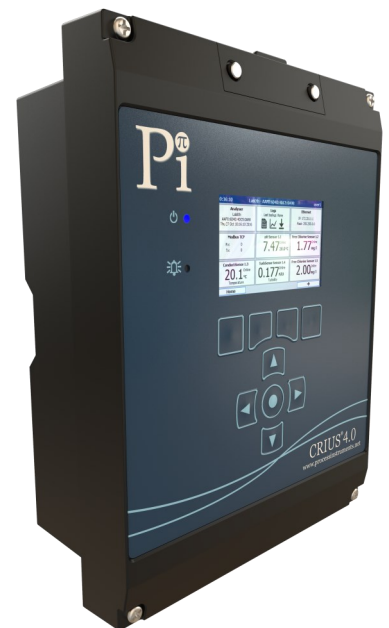
Contrôleur CRIUS® 4.0